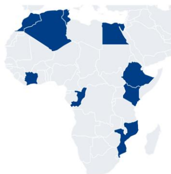
9 Nazioni pilota · Gen 2024

Il perimetro si è ampliato secondo una logica incrementale, con lo sguardo all'intero continente: dalle 9 Nazioni pilota (gennaio 2024) alle 14 del primo ampliamento (gennaio 2025), fino alle 18 Nazioni partner dell'attuale perimetro operativo (marzo 2026).